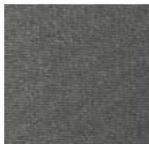
3439 FORCE BASALTO