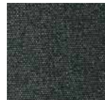
3441 FORCE NEGRO