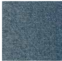
3437 FORCE MARINO