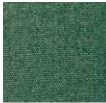
3436 FORCE BOTELLA