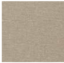
3433 FORCE CAMEL