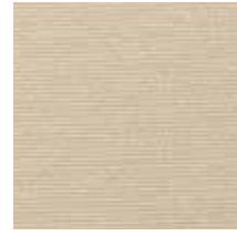
3432 FORCE BEIGE