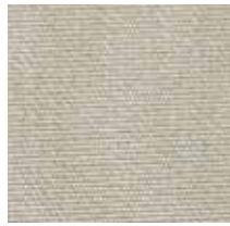
3434 FORCE TENNERE